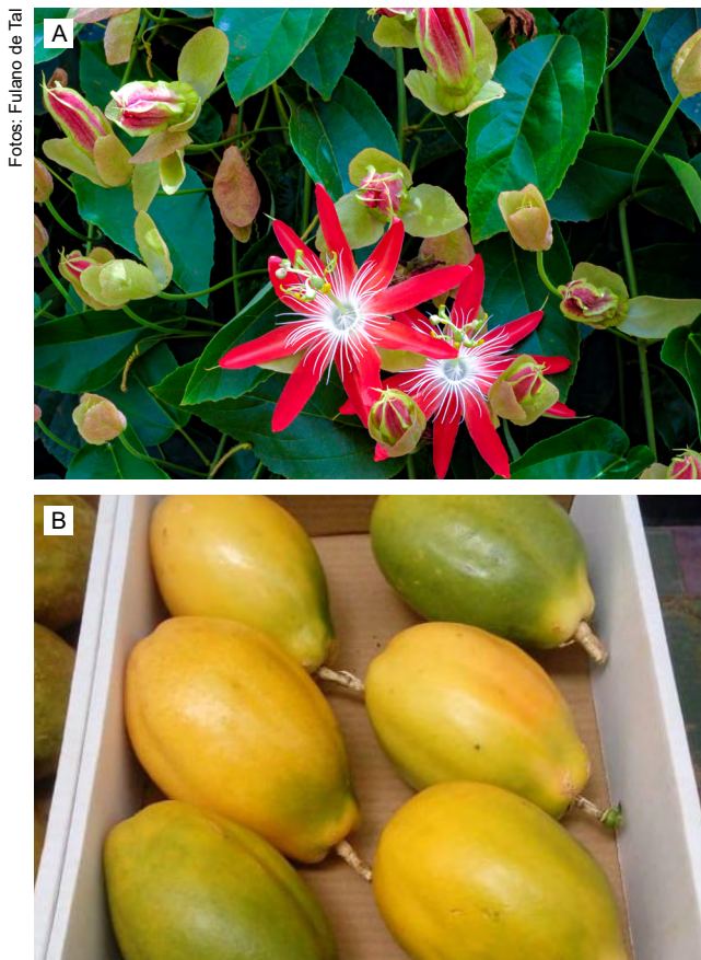
Figura 1.2. Assim quam sequati osaped quiatet (A) et us-daerchic to et laceatur recust ma sincia volor susam (B).