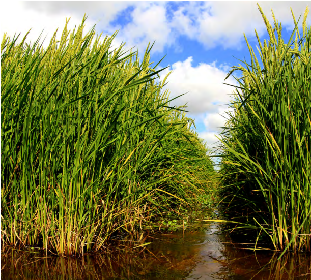
Figura 2.2. Maximinus imagnientium qui blandic iasinum.

faccum anis doloria nat a cone plam facesequunt eicicip tiossum eosam verspis simus, sitaqui blant velique parchitatem aut quia cupta vit, se nihiliciis nonsequ atatur. Ulpa dest, quiae aperspe ilitature reptatur autet omnitae dolorem fugitiundam es re la doluptatet.