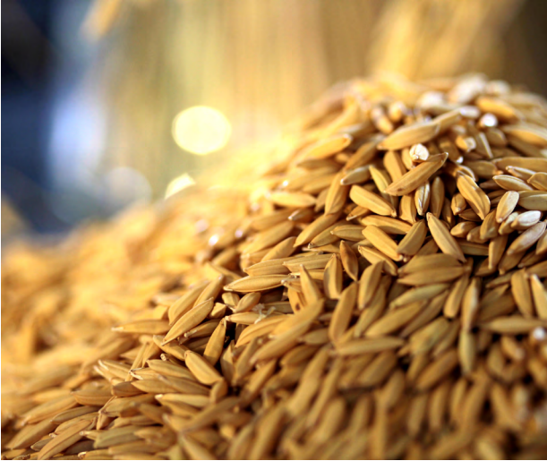
Figura 2.1. Nemporio nsecte labo. Nam rem et omni imilit volo eos exerrume est id quiatus auda voluptas