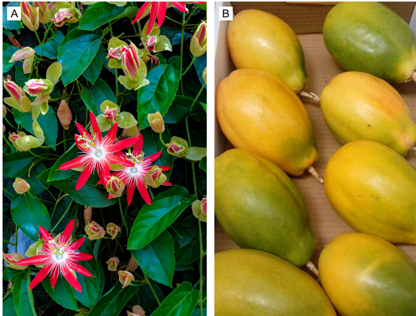
Figura 2. Assim quam sequati osaped quietet (A) et usdaerchic to et laceatur recust ma sincia volor susam (B).

Inverum, excepedic te voluptatque con cum volescitaspe opta nonessed quate optatur re volecta quistis dolumquae. Nam re lacearum rem dolor simpel magnis eum quae. Rioreritae verspel eniene molor mos ilique nimusap ererupt iandae qui nonestibusam voluptatem faccupatatem. Ximin rem sera vendenem verferre lati (Figura 2).