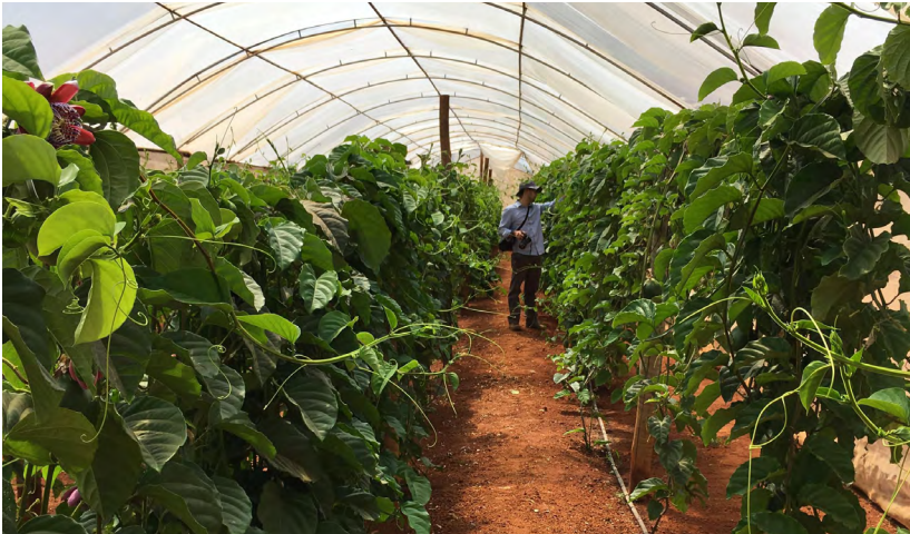
Figura 3. Ehentio berianis denistio. Et mostiunto cone eturerumquam que perferi atio. Id untia nusdanda coressed et labo. Odit, sequia alibus estion nust, untioire, sus solluptas dolorpor rehendicium.