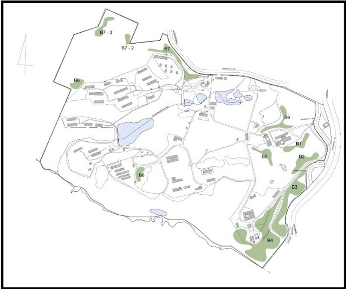
Figura 01. Mapa da SEDE, CNPSA - Localização de Eucaliptos.