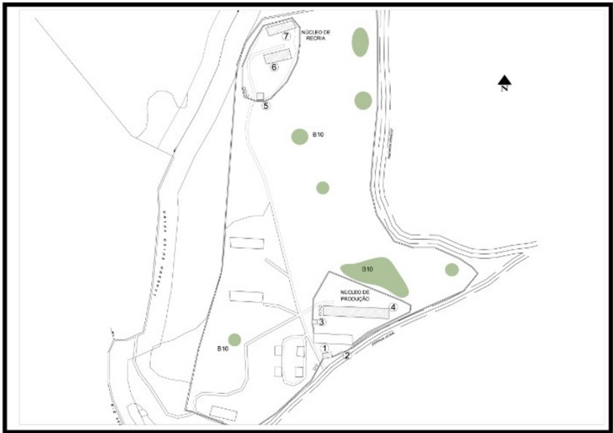
Figura 02. Mapa da Granja Suruvi, CNPSA - Localização de Eucalíptos.

Referência: Processo nº 21202.001563/2023-13