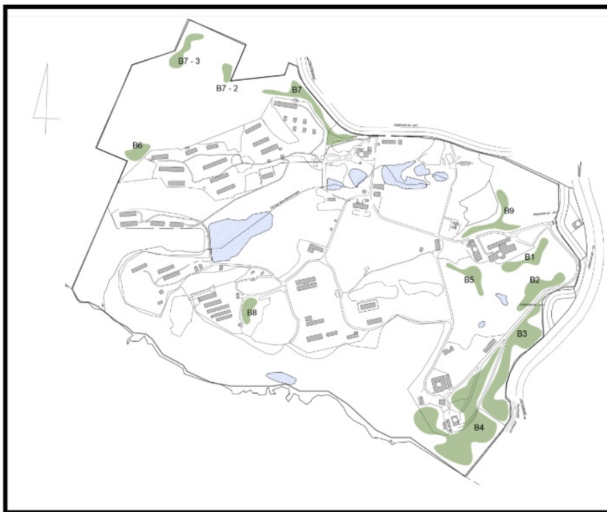
Figura 01. Mapa da SEDE, CNPSA - Localização de Eucaliptos.