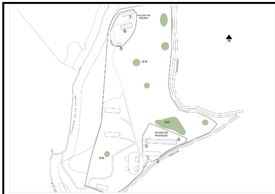
Figura 02. Mapa da Granja Suruvi, CNPSA - Localização de Eucaliptos.