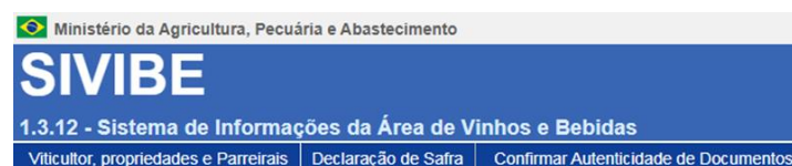
Figura 2. Ilustração do menu principal do SIVIBE.

A Figura 2 apresenta o menu principal do SIVIBE. As opções “ Viticultor, Propriedades e Parreirais ” e “ Declaração de Safra ” permitem o cadastramento de informações relacionadas com a atividade vitícola. A opção “ Confirmar Autenticidade de Documentos ” pode ser utilizada por qualquer pessoa e/ou instituição que objetiva verificar a veracidade de documentos gerados a partir do SIVIBE.