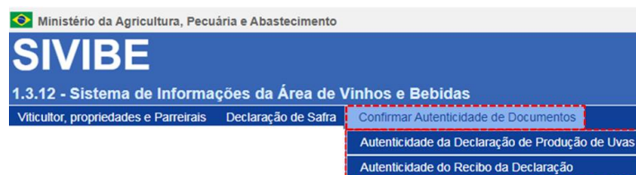
Figura 6. Ilustração do caminho para confirmar a autenticidade de documentos no SIVIBE.